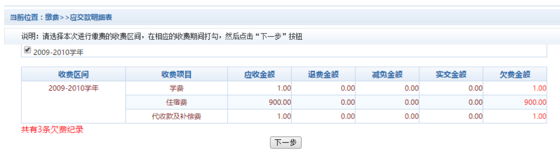
图 3.4-1 学费欠费信息

A. 选择缴费学年。如图 3.4-1 所示，选择需要缴费的学年，点击“下一步”按钮，缴费用。