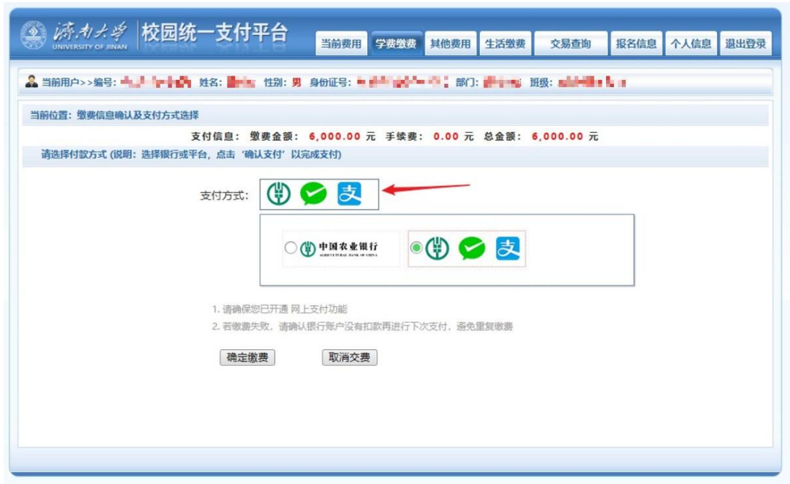
图 3.4-4 缴费方式选择

如图 3.4-4 所示, 确定支付金额无误后, 选择微信支付, 进入如图 3.4-5 所示 点击微信支付后, 将会弹出微信二维码, 请使用微信扫一扫进行扫码支付。