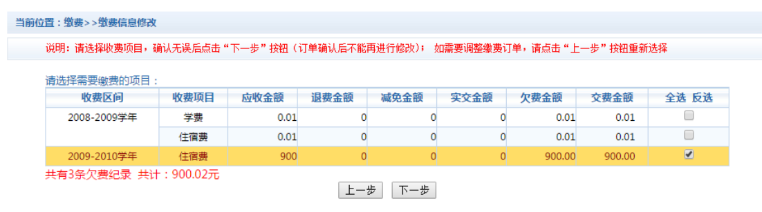
图 3.4-2 缴费项目选择