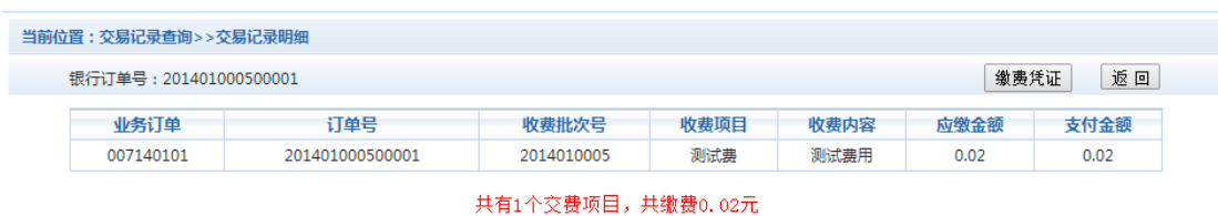
图 3.5-2 交易记录明细