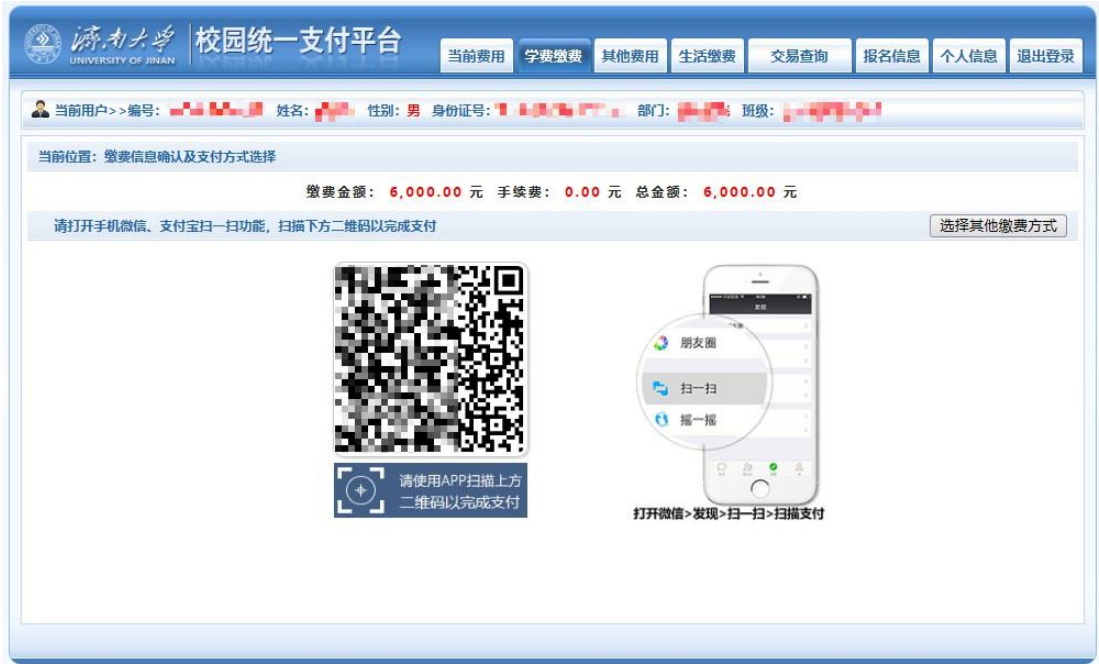
图 3.4-5 微信扫码支付