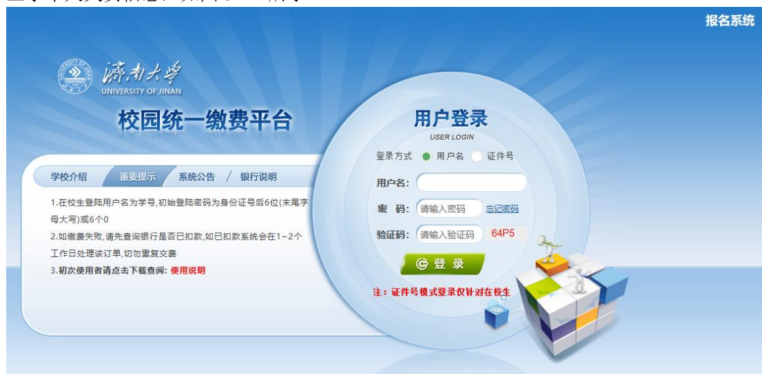
图 3.1-1 统一支付平台登陆界面

在浏览器地址栏输入 http://jdzjhf.ujn.edu.cn/xysf/login.aspx ，如图 3.1-1 所示。登陆之后显示个人欠费信息，如图 3.1-2 所示。