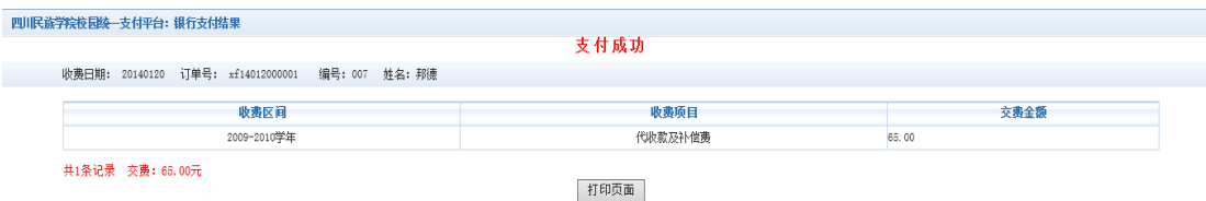
图 3.4-8 支付成功