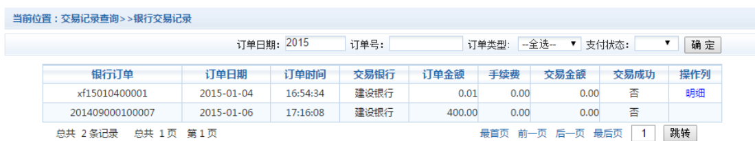
图 3.5-1 交易记录查询

点击导航栏的“交易记录查询”按钮，可以查询具体的银行交易记录。如图 3.5-1 所示。