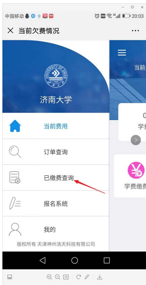
图 8 已缴费查询