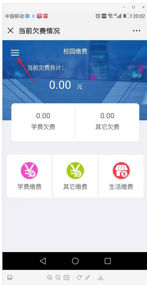
图 7 支付平台主页面