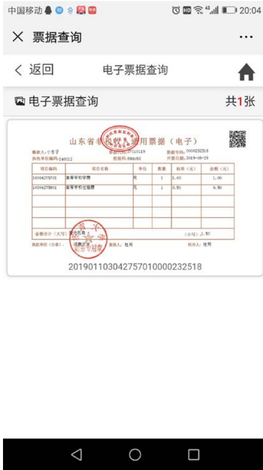
图 11 生成电子票据。