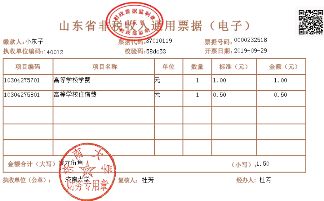
图 12 电子票据图片