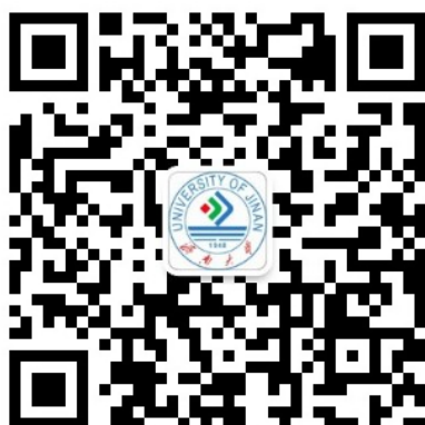
图 1 济南大学计划财务处公众号

1. 用手机微信扫一扫功能扫描下方的“济南大学计划财务处”微信公众号并添加关注。进入公众号后（图 1），点击下方的【在线缴费】菜单（图 2）。