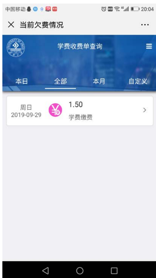
图 9 缴费明细

6. 电子票据查询方式：点击需要生成电子票据的缴费明细条框（图 9），点击蓝色“查询”链接（图 10）即可生成电子票据，可以长按电子票据图片就它保存到本地（图 11，图 12）。