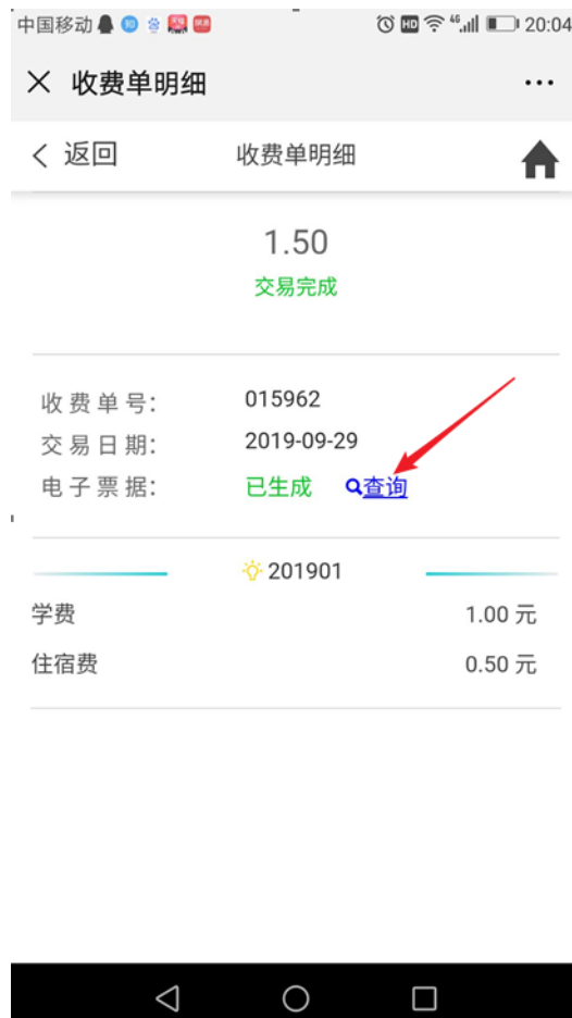
图 10 查询电子票据