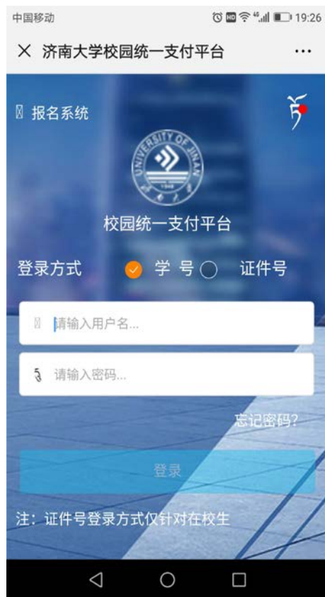
图3 统一支付平台登录页面

2.在登录页面输入学号及密码（初始密码为身份证号后六位，末尾字母大写，无身份证信息的初始密码6个0）。（图3）