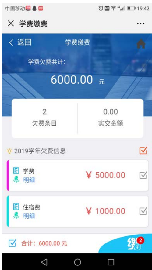
图 5 缴费页面